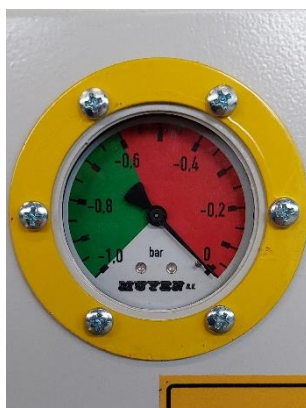
Vacuümmeter (van één vacuümsysteem)