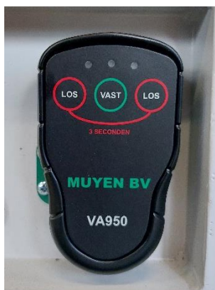
Afstandsbediening met vast en los knoppen