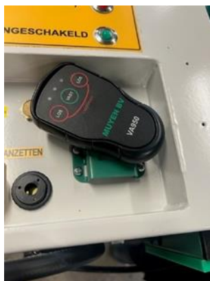
Afstandsbediening in en uit houder