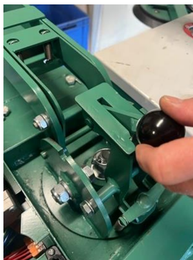
Draaien: eerste beweging