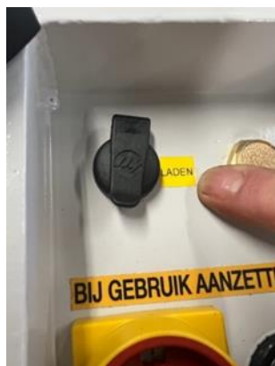
Oplaadpunt voor lader