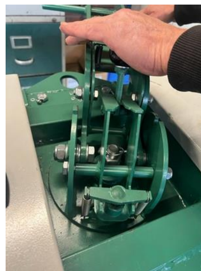
Draaien: tweede beweging