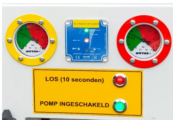
Twee vacuümmeters (voor ieder vacuümsysteem) + battery watch + indicatorlampen rood en groen