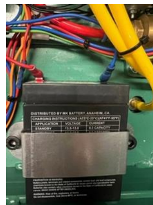
Batterij + schuifstekkers